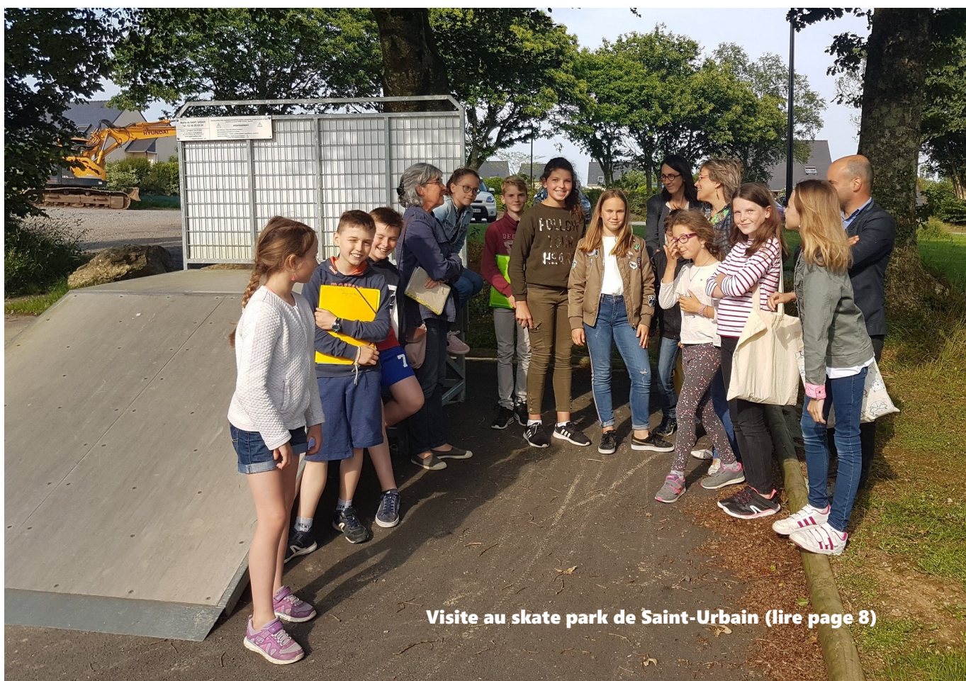
Visite au skate park de Saint-Urbain (lire page 8)