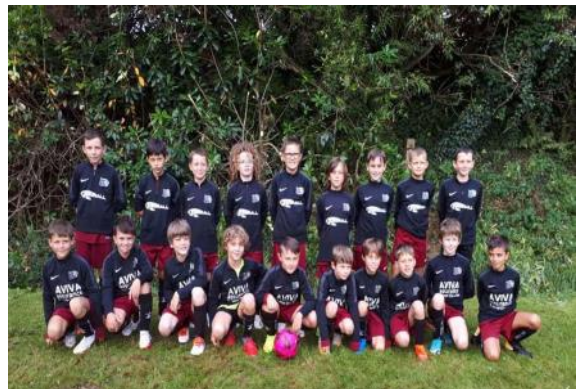
Les U11 2021/2022 du FAR

Organisation : Football Associatif de la Rade